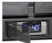
Regler mit Abdeckklappe