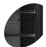
LED-Beleuchtung im Türrahmen