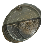
Innenlüfter und Korb